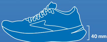
Sula utan styv platta

Sedan 2020 får skor i elitävlingar på väg inte ha tjockare sula än 40 mm. För spikskor på bana gäller 20 eller 25 mm. Endast ett styvt lager i sulan är tillåtet (spikinfästning på spikskor ej inräknad). Svenska Gymnastik- och idrottshögskolan, GIH, har spelat en viktig roll i utformningen av dessa internationella regler. Efter alla världsrekord i friidrott skickas skorna till GIH i Stockholm för kontroll.