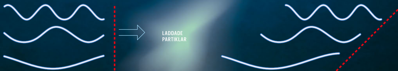
1. RADIOVÅGOR FÖRE PASSAGE

Ingen vet med säkerhet hur radioblixtar uppstår. En modell går ut på att de skapas av utbrott på ytan av en magnetar, det vill säga en rest av en död stjärna med oerhört starkt magnetfält. Utbrottet får elektroner och andra laddade partiklar att slungas ut med hög hastighet. Dessa partiklar stöter ihop med det omgivande höljet av partiklar som tidigare har kastats ut från magnetaren. Då bildas nya kraftiga fält där elektronerna leds i spiralrörelser kring magnetfältslinjerna. Elektronerna fungerar då som antenner som sänder ut radiostrålning.